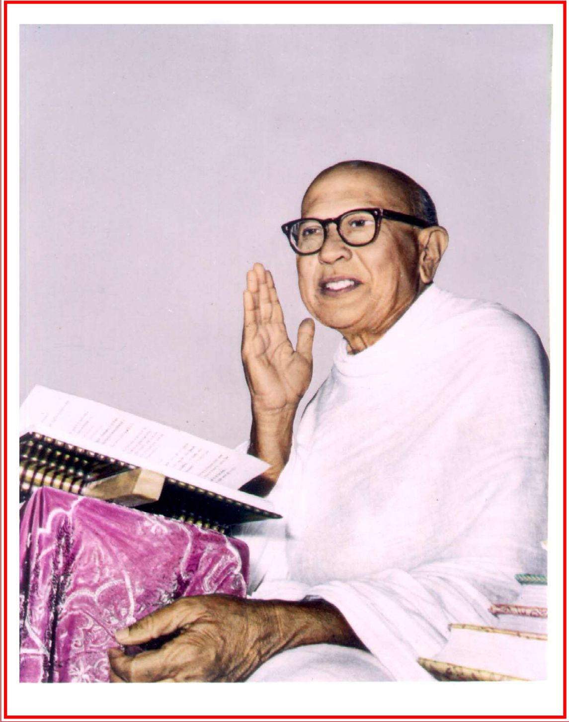
अध्यात्मयुगसर्जक पूज्य गुरुदेवश्री कानञ्जस्वामी